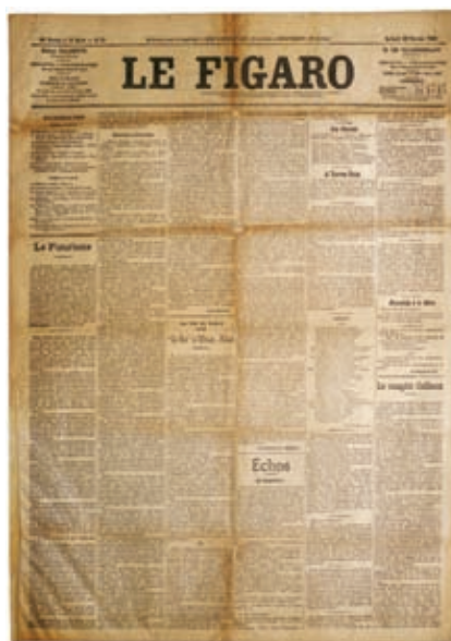
La prima pagina di "Le Figaro" del 20 febbraio 1909

– Andiamo, diss'io; andiamo, amici! Partiamo! Finalmente, la mitologia e l'ideale mistico sono superati. Noi stiamo per assistere alla nascita del Centauro e presto vedremo volare i primi Angeli! ... Bisognerà scuotere le porte della vita per provarne i cardini e i chiavistelli! ... Partiamo! Ecco, sulla terra, la primissima aurora! Non v'è cosa che agguagli lo splendore della rossa spada del sole che scher-