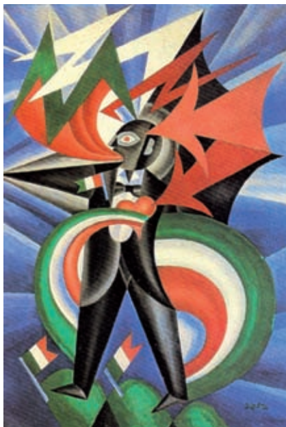
Fortunato Depero: Marinetti temporale patriottico- Ritratto psicologico (1924)

Avevo appena pronunziate queste parole, quando girai bruscamente su me stesso, con la stessa ebrietà folle dei cani che vogliono mordersi la coda, ed ecco