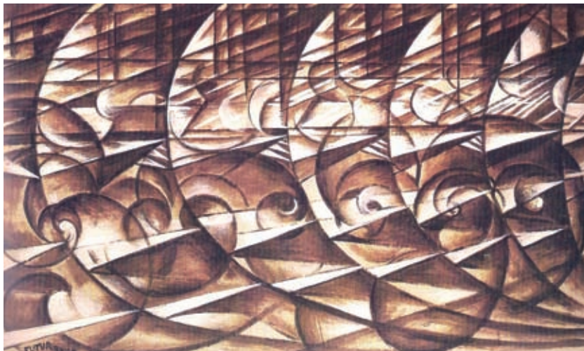
Giacomo Balla: Espansione dinamica + velocità (1913)

Essi tumultueranno intorno a noi, ansando per angoscia e per dispetto, e tutti, esasperati dal nostro superbo, instancabile ardore, si avventeranno per ucciderci, spinti da un odio tanto più implacabile inquantoché i loro cuori saranno ebbri di amore e di ammirazione per noi.