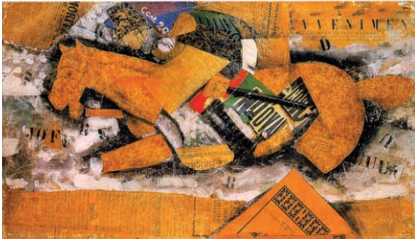
Carlo Carrà: Inseguimento (1914)

patriottismo, il gesto distruttore dei libertari, le belle idee per cui si muore e il disprezzo della donna.