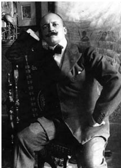
Filippo Tommaso Marinetti fotografato nella casa milanese di Corso Venezia

Finalità del Comitato Nazionale è quella di promuovere le celebrazioni del centenario della pubblicazione (20 febbraio 1909) sul quotidiano parigino "Le Figaro" del Manifesto di fondazione del Futurismo, ad opera di Filippo Tommaso Marinetti e di diffondere – mediante il coordinamento e la valorizzazione di mostre, convegni, pubblicazioni, eventi musicali, filmografia e audiovisivi, eventi spettacolari - la conoscenza del Movimento che ne discese. Movimento che interessò tutti i campi della attività umana, ebbe vastissimi echi e adesioni internazionali e costituisce il più importante contributo italiano alla vicenda delle Avanguardie storiche e alla cultura internazionale del XX secolo. Il Comitato Nazionale cura un proprio sito ( www.centenariofuturismo.it ) in cui sono segnalate, a livello internazionale e nei limiti di quanto a sua conoscenza, le mostre, le pubblicazioni, le iniziative che hanno per oggetto il centenario del movimento marinettiano.