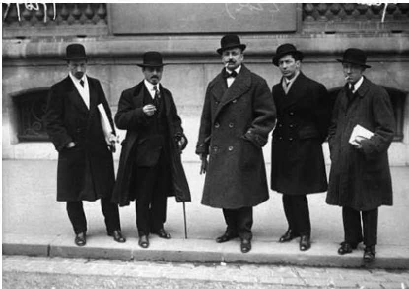
Russolo, Carrà, Marinetti, Boccioni e Severini a Parigi nel 1912

9. Noi vogliamo glorificare la guerra – sola igiene del mondo – il militarismo, il