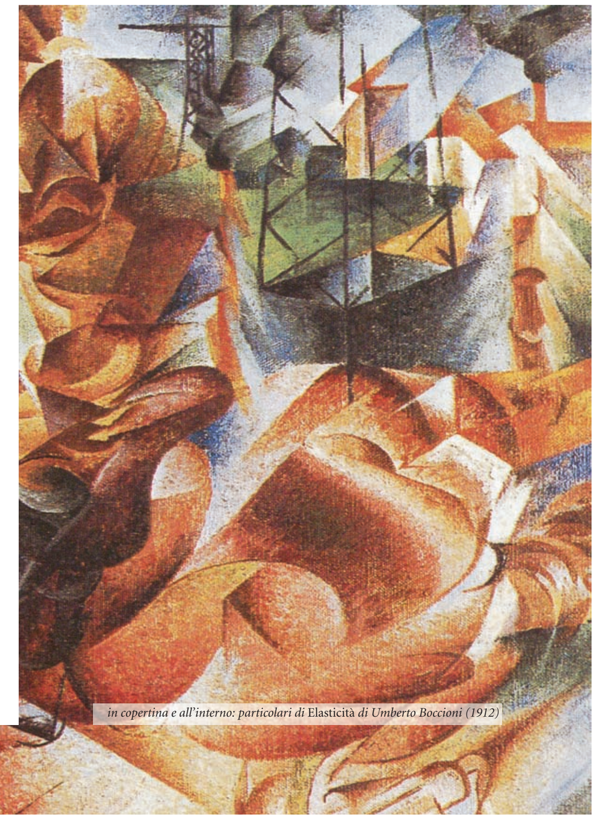
in copertina e all'interno: particolari di Elasticità di Umberto Boccioni (1912)