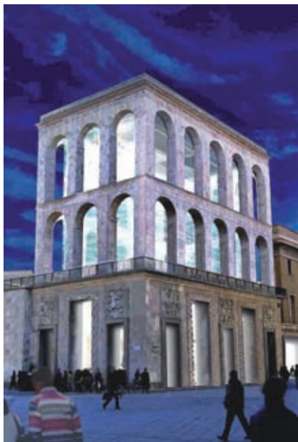
Veduta virtuale del Museo del Novecento

CLP Relazioni Pubbliche - via Fontana, 21 - 20122 Milano telefono: 02 433403 - 02 36571438 - fax: 02 4813841 - email: info@clponline.it